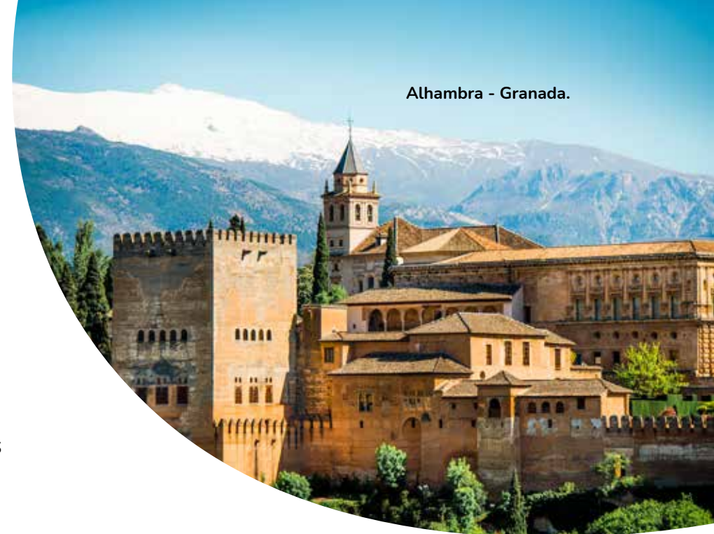
Alhambra - Granada.