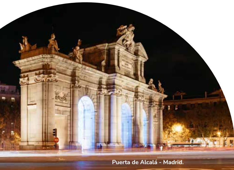
Puerta de Alcalá - Madrid.

*Las excursiones o visitas opcionales no forman parte del itinerario. En caso de querer realizarlas, se abonan al momento de realizar la excursión.