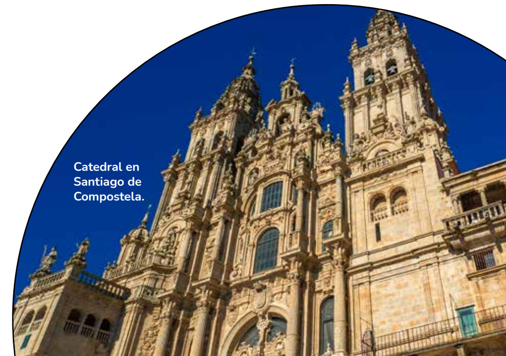
Catedral en Santiago de Compostela.